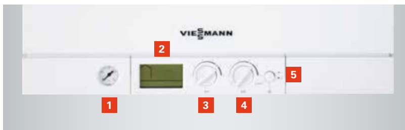
Regeling met geïntegreerd diagnosesysteem

Bij de laadboiler wordt het water dat in de warmtewisselaar (doorstroomverwarmer) op de gewenste temperatuur is gebracht, continu bijgevuld, zodat het bij verdere afname onmiddellijk ter beschikking staat. Temperatuursensoren zorgen ervoor dat de vooraf ingestelde temperatuur wordt bereikt en aangehouden. Indien nodig wordt bij de Vitodens 111-W automatisch de MatriX-cilinderbrander ingeschakeld, die op zijn beurt voor de gewenste watertemperatuur zorgt. Dit kan bijzonder nuttig zijn, bv. bij het vullen van een bad of het nemen van een uitgebreide douche.