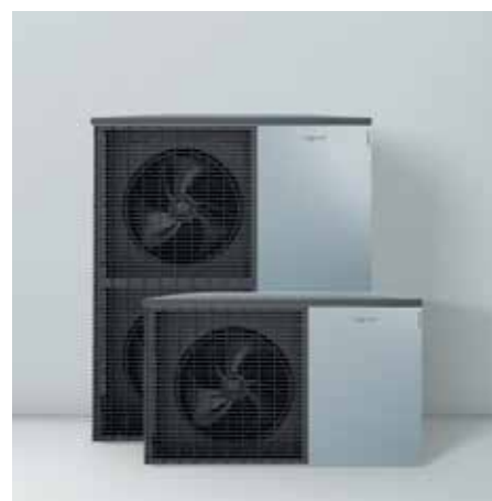
Buitenunits in Viessmann-design: Made in Germany

De regeling heeft een eenvoudige en intuïtieve bediening. Met de Vitoconnect-webinterface (toebehoren) en de gratis ViCare-app kan het systeem ook op afstand via smartphone bediend worden. En daarenboven kan de installatie, mits toestemming van de gebruiker, ook online via de Vitoguide-software door een verwarmingsspecialist opgevolgd worden. Warmtepompen die aangesloten zijn via de Vitoconnect webinterface genieten van 5 jaar garantie.