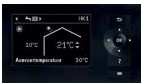
Display van de warmtepompregeling Vitotronic 200