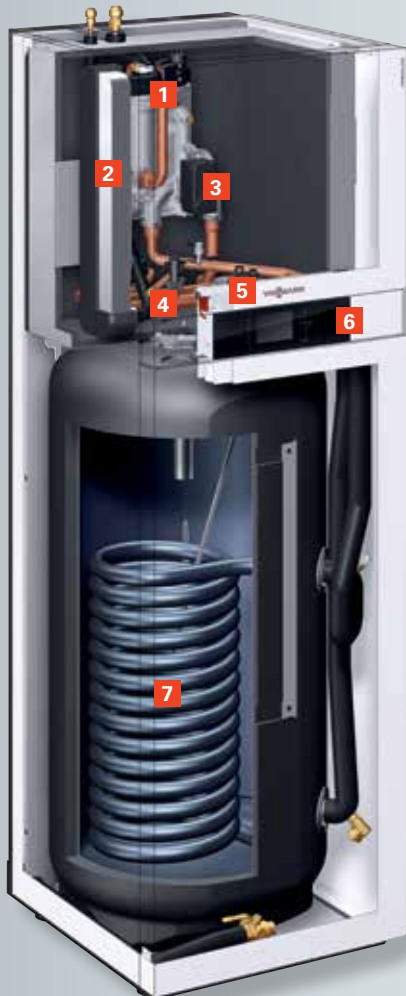
Vitocal 222-S Binnenunit