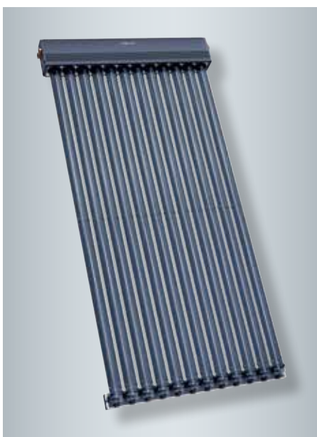
Hoogrenderende vacuümbuiscollector Vitosol 300-TM (type SP3C)