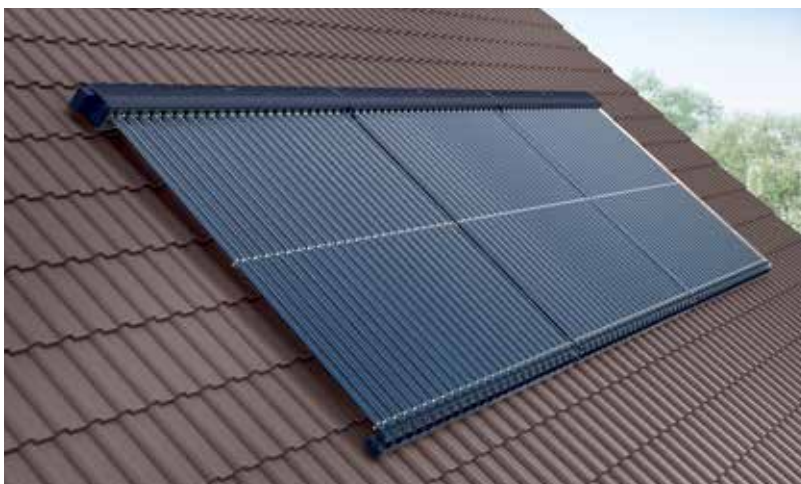
Universeel inzetbaar dankzij plaats-onafhankelijke montage, verticaal of horizontaal, op daken en gevels, maar ook vrijstaand

Dankzij de 'droge koppeling' kunnen de buizen bij onderhoudswerken snel en eenvoudig vervangen worden, ook als de installatie gevuld is.