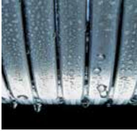
Inox-Radial-warmtewisselaar – duurzaam en efficiënt

De gascondensatieketels Vitodens 200-W en Vitodens 222-W bieden een efficiënte en voordelige oplossing voor kleine en grote warmtebehoefte.