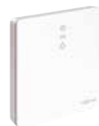
Vitoconnect met aansluitingen voor de stekkeradapter (links) en voor de dataverbinding

Voor de regeling van het verwarmingstoestel maakt ViCare gebruik van de Vitoconnect-webinterface. Zodra de gebruiker daartoe zijn akkoord heeft gegeven, kan de verwarmingsspecialist de installatie van zijn klant via Vitoguide te allen tijde monitoren.